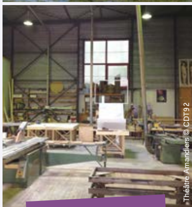
Théâtre Amandiers