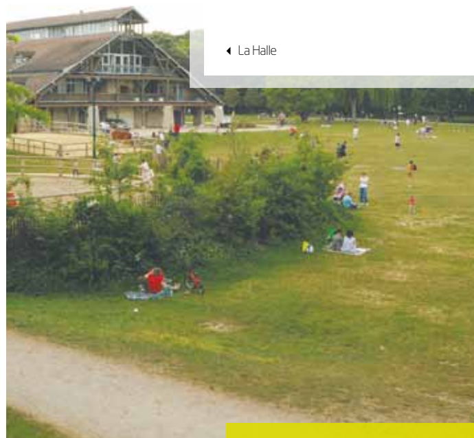
◀ La Halle